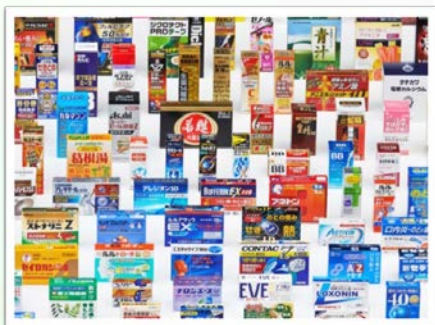
店頭医薬品向けパッケージ