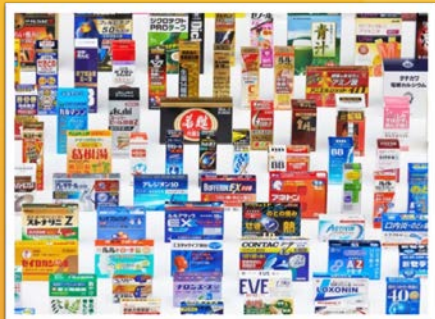
店頭医薬品向けパッケージ